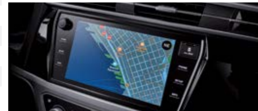
9" wyświetlacz z systemem nawigacji GPS (TomTom)