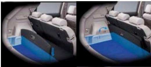
Dwupoziomowa podłoga bagażnika (dla 2WD)