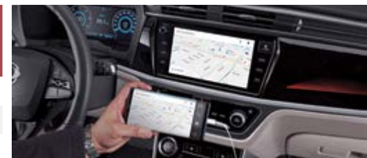
Zgodność z systemami Android Auto/Apple CarPlay