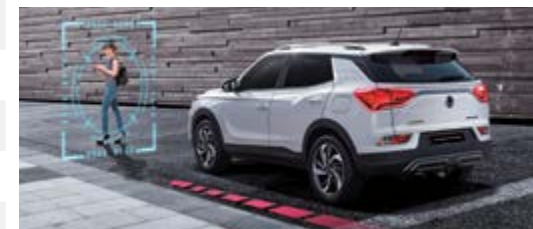
AEBS – system autonomicznego hamowania