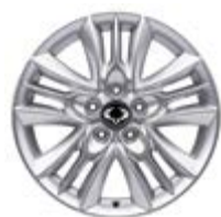
17" felgi aluminiowe z oponami 225/60