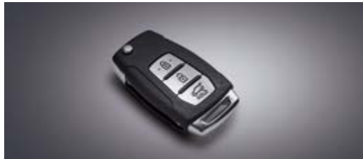
System bezkluczykowy (Keyless)