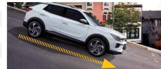
HDC – system kontroli zjazdu ze wzniesienia