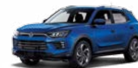
Dandy Blue (metal.)