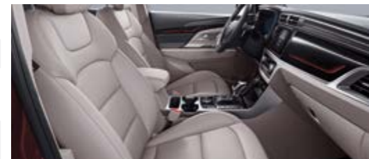
Stylizacja jasno-szara (materiał lub skóra)