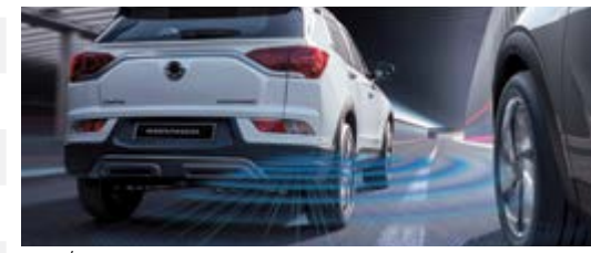
LCA/BSD – system monitorowania martwego pola