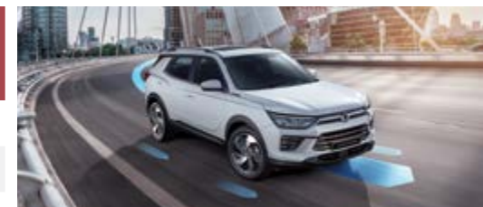
ARP – system aktywnej ochrony przed dachowaniem