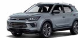
Platinum Gray (metal.)