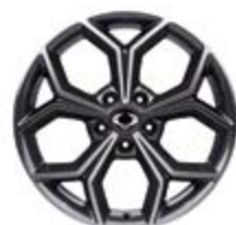
18" felgi aluminiowe „diamentowe” z oponami 235/55