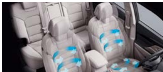
Wentylowane fotele z przodu