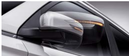
Zewnętrzne lusterka składane elektrycznie