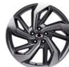
19" felgi aluminiowe „diamentowe” z oponami 235/50