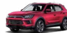
Cherry Red (metal.)