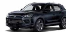
Space Black (metal.)